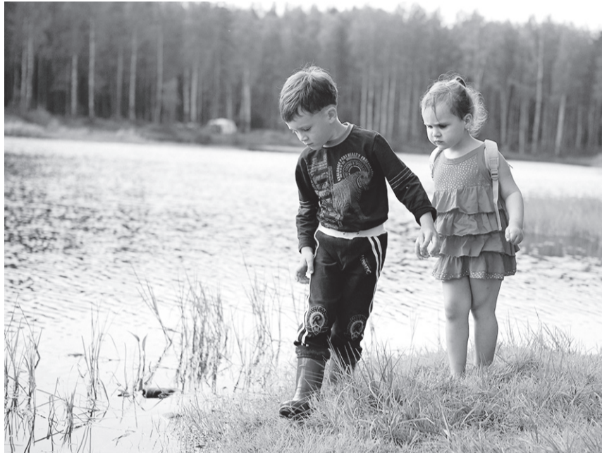
Встретить клещей можно в парковых зонах и на городских газонах весной и в начале лета. С июля их активность снижается, но в теплых регионах может продолжаться до октября.

- Иммунопрофилактика (обнаружив вшившегося клеща, срочно обратитесь в любую поликлинику или травмпункт для введения противоклещевого иммуноглобулина, кото-