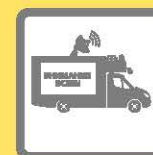
ПОДВИЖНЫЕ ЗВУКОУСИЛИТЕЛЬНЫЕ УСТАНОВКИ