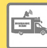
ПОДВИЖНЫЕ ЗВУКОУСИЛИТЕЛЬНЫЕ УСТАНОВКИ